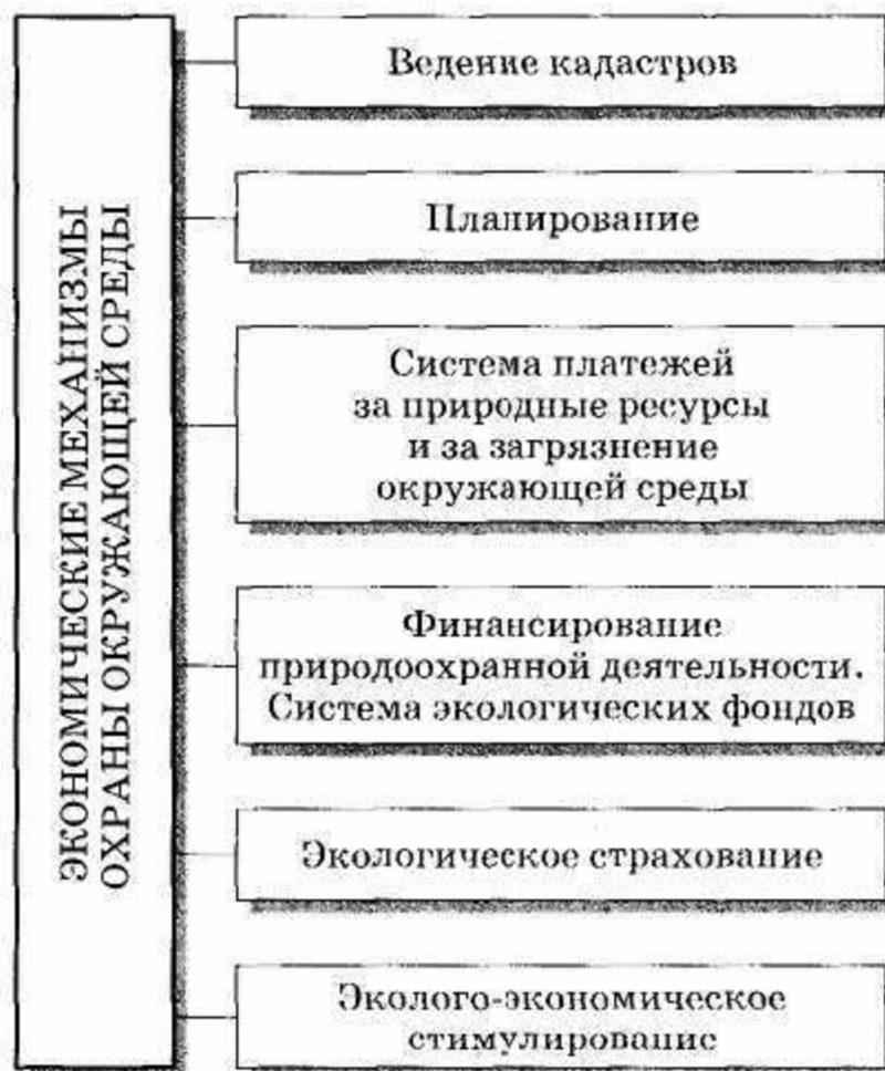
Рис. 4. Схема экономического механизма охраны ОС

Существующая в наши дни в России система экономических механизмов охраны ОС может быть представлена схемой, приведенной на рис. 4.