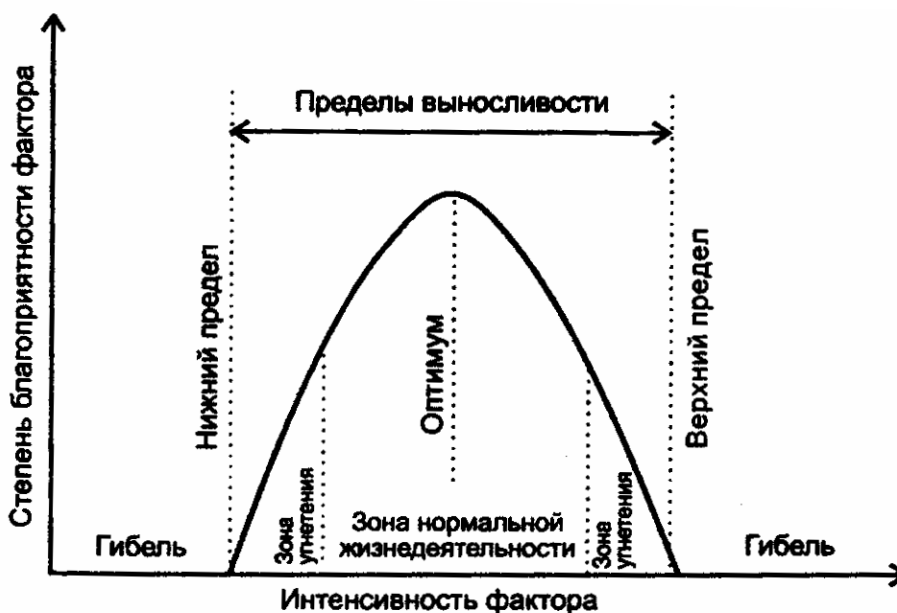
Рис. 1. Зависимость действия экологического фактора от его интенсивности

несколько градусов, поэтому лучше здесь говорить о зоне оптимума . Весь интервал температур, от минимальной до максимальной, при которых еще возможен рост, называют диапазоном устойчивости (выносливости) или толерантности. Точки, ограничивающие его, т.е. максимально и минимально пригодные для жизни температуры, — это пределы устойчивости . Между зоной оптимума и пределами устойчивости, по мере приближения к последним растение испытывает все нарастающий стресс, т.е. речь идет о стрессовых зонах или зонах угнетения в рамках диапазона устойчивости (рис. 1). По мере удаления от оптимума вниз и вверх по шкале не только усиливается стресс, а, в конечном итоге, по достижении пределов устойчивости организма происходит его гибель.