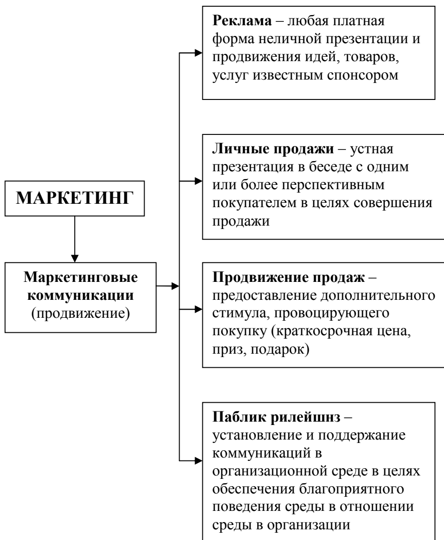
Рис. 1. Паблик рилейшнз в маркетинге

Аналогом «продвижения» в широком смысле в маркетинге является термин «маркетинговые коммуникации». Маркетинговые коммуникации – один из разделов дисциплины «маркетинг» (рис. 1). Значение маркетинговых коммуникаций в теории и практике российского маркетинга постепенно растет вместе с осознанием роли коммуникаций в решении конкретных проблем организаций и предприятий на российском рынке.